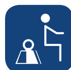
Max brukartvikt ▼