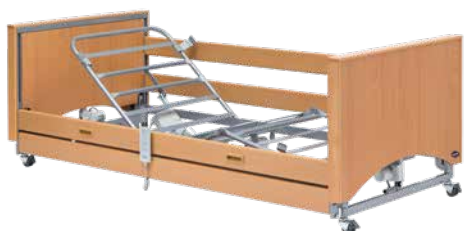
▶ Invacare® Medley Ergo