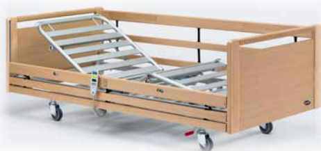
▶ Invacare® SB 755