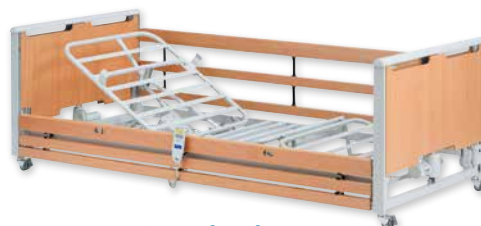
▶ Invacare® Etude Plus